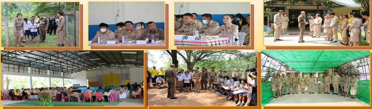
ข่าว/ภาพโดย... จีรพรรค ดวงจำปา นักประชาสัมพันธ์ชำนาญการพิเศษ สพป.หนองบัวลำภู เขต ๑

บุคลากรทางการศึกษา ร่วมต้อนรับ ใน ผอ.โรงเรียนบ้านหนองกุงแก้ว ได้นำเสนอ งานตาม 5 กลยุทธ์การพัฒนาโรงเรียนใน พัฒนาโรงเรียนให้เป็นบ้านหลังที่สองของ Farm School กับการจัดการเรียนการสอน ชมฐานกิจกรรมการเกษตร Farm school